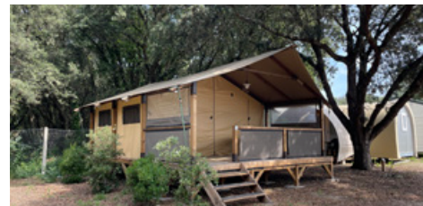
TENTE LODGE BALI

Idéalement placé au plus près de l'océan, cet hébergement insolite et confortable invite à l'évasion. Deux chambres (1 lit 140x190 + 2 lits 80x190), coin repas et terrasse couverte, véritable pièce de vie supplémentaire. Point d'eau et sanitaires à proximité.