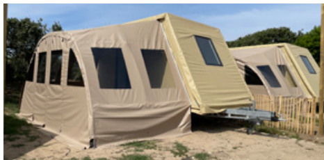
COCO SWEET COTE MER

Ce logement insolite et économique, sans sanitaires, à mi-chemin entre la tente et le mobil-home, offre tout l'essentiel pour passer de belles vacances : deux chambres (1 lit 140x190 + 2 lits 80x190) et un coin repas. Point d'eau et sanitaires à proximité.